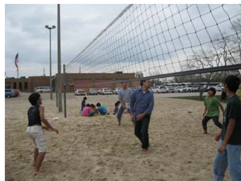
Volley Ball olah raga keroyokan yang diminati remaja dan dewasa.

Paling tidak option itu sudah ada. Dan sudah sepantasnya kalau semua masyarakat memperoleh informasi akan adanya option itu.