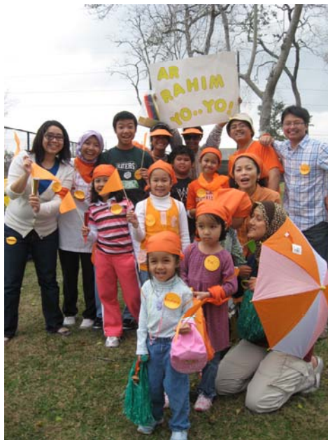
Ar-Rahim Team (Oranye)