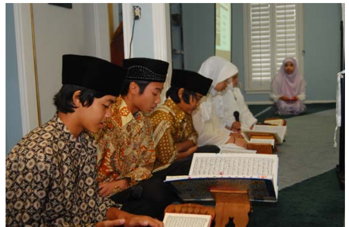
Bayyati Performance Group