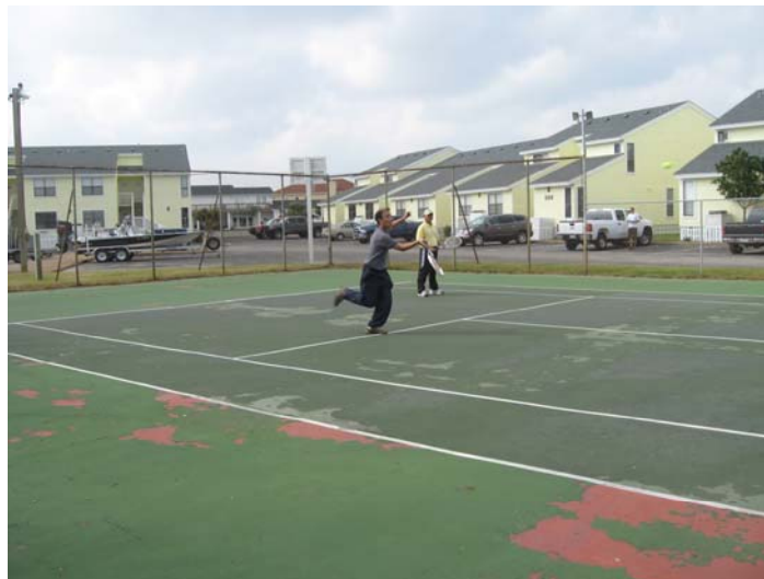
Jadwal main tennis seperti jadwal minum obat, (Tiga kali sehari)

At last, ukhuwah Islamiyah dapat kita jaga antar keluarga, dan juga, anak-anak dapat bermain di lingkungan yang