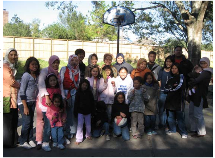
This memory will stay.....

dapat mengambil hikmah dari apa saja yang sudah kita peroleh selama ini. Insha Alloh , hanya dengan ridlo-Nya, kita nanti akan dipertemukan kembali dalam kondisi yang lebih baik. Amin.