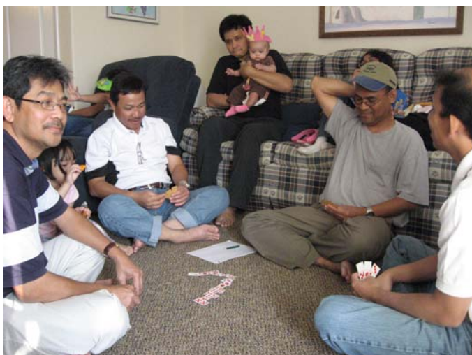
Team Gable yang selalu siap setiap saat. Dengan pasangan yang sama setiap saat juga :-)

Well, we are working on it. Tell us if you have any idea and suggestion. If it is do-able, let's make it happen. (AP1)