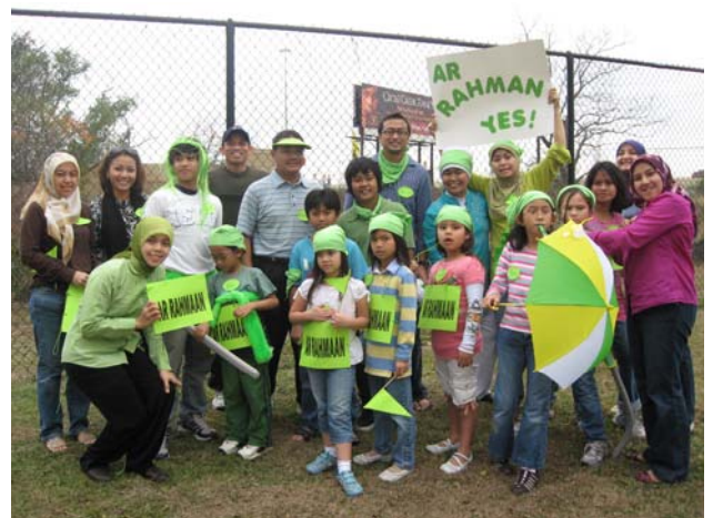
Ar-Rahman Team (Hijau)