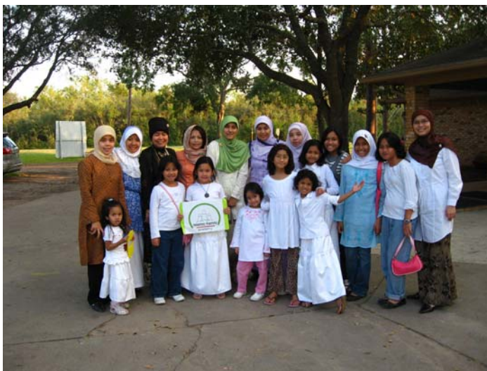
Setelah acara selesai... yang tertinggal hanya kenangannya